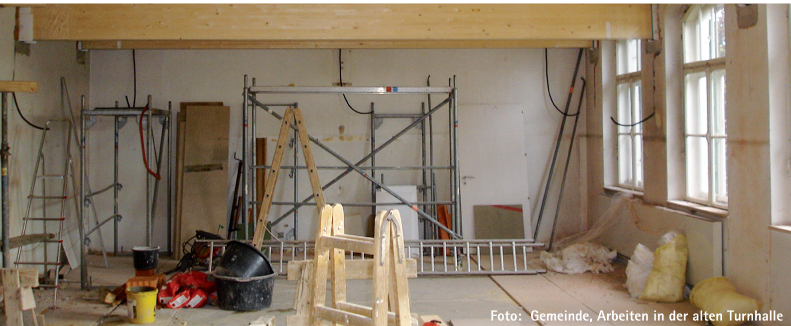
Arbeiten in der alten Turnhalle

mit den Ortsteilen Riedhausen, Rieden, Seeleiten